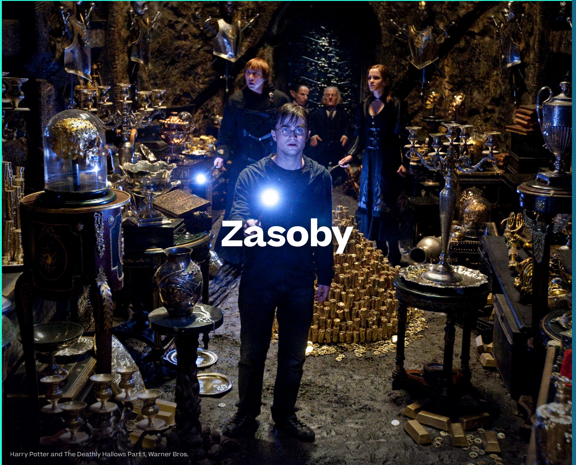
Harry Potter and The Deathly Hallows Part 1, Warner Bros.